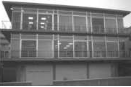
Mersin Deniz Ticaret Odası