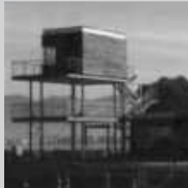
Ece Marina - Fethiye

Yapıları hafif arka plan unsurları olarak kullanan, ve dış mekan sürekliliği ve kullanımını öne çıkaran yaklaşımı ile Boran Ekinci'nin FETHİYE ECE MARİNA çevresinin, 'Yaşam Çevresi' kategorisinde değerlendirilmesine ve bu kategoride ödüllendirilmesine; malzeme, teknik ve dil bütünlüğünü kurgulama ve inceltmede üst düzeyde bir çizgi elde ettiği nedeniyle oy birliği ile karar verilmiştir.