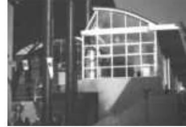
Fethiye Kültür Merkezi

Çevreyle ilişkide üstün duyarlılık, kullanılan dilde karşıtlar arasında gözetilen denge ve zıtlıkların özgün kurgusu; iklim ve yer referanslı bir 'saçak yapı' yoluyla, malzeme ve biçim rafineliliğine dayalı yerleşik değerleri sorgulayan, ve bu sorgulamayı estetiğin alternatif örgüsüne yönelik inanca ısrar ve tutarlıkla sürdürüşü nedeniyle Kenan Güvenç ve Gülnur Özdağlar Güvenç'in FETHİYE KÜLTÜR MERKEZİ yapısına oyçokluğu ile (kararı oy Nejat Ersin) verilmesine karar verilmiştir.