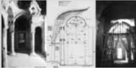
Ürgüp Sarıca Kilise Koruma, Onarım ve Sergileme Projesi

Dünya mirası bir site ait önemli bir kültür varlığının zamanla bozulan taş dokusunun dikkatle sağlamlştırılması, bezemelerinin özenle yenilenmesi, çevresel sorunlarının koruyucu önlemlerle çözümlenmesi, ve iç mekanın gezilip algılanmasına yönelik yeni işlev düzeni ile KA-BA Eski Eserler Koruma ve Değerlendirme Mimarlık Ltd. çalışması olan ÜRGÜP SARICA KİLİSE KORUMA ONARIM VE SERGİLEME PROJESİ' ne oy birliği ile verilmiştir.