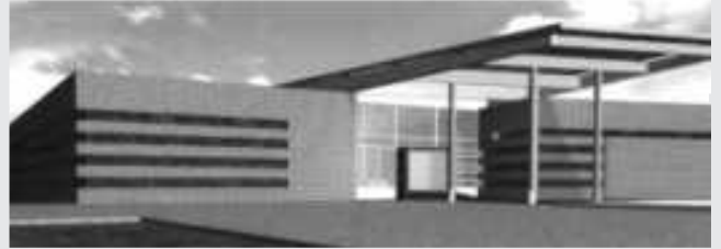
Abant İzzet Baysal Üniversitesi Sosyal Aktivite Merkezi