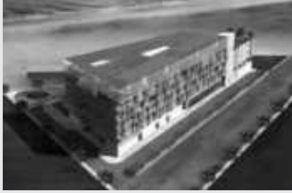
Tunus Mahdiyya'da Otel ve Konut

Bilinen estetik değer ve teknik unsurlar içinde kalmasına karşın, özellikle detay ve ölçek duyarlılığı ile, tasarımı benzerlerinden farklı kılan duyarlı yaklaşımı;