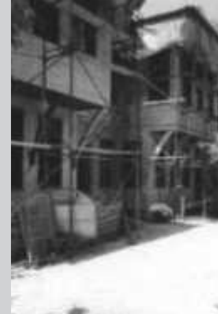
Sadullah Paşa Yalısı Onarım Projesi