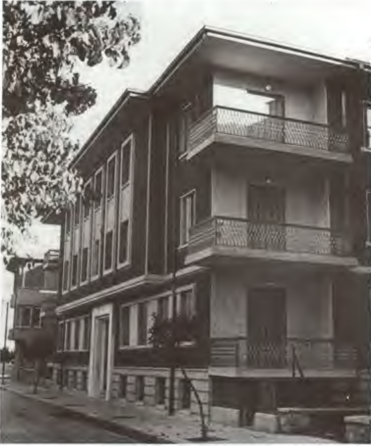
Yayla 7 - 1110