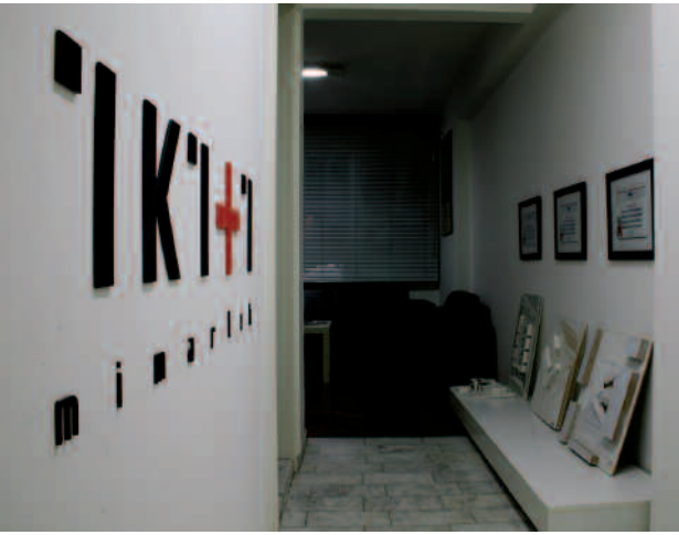
ÜSTTE 'İK'I+I' Mimarlık Ofisi girişi