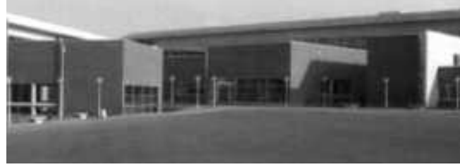
TED Ankara Koleji Yumrubel Yerleşkesi – Lise

Yer aldığı imar içinde özenli konumlanması, çekinmeden üzerine gidilen sıradanlık aracılığıyla erişilen seçkinlik ve zaman ötesi klasik kimlik; bu doğrultudaki tutumun sürekliliğini sağlayan, azaltarak varılmış bütün, ölçü, ölçek ve ayrıntılardaki paralel dikkat nedeniyle Kaya Arıkoğlu'nun MERSİN DENİZ TİCARET ODASI yapısına oybirliği ile;